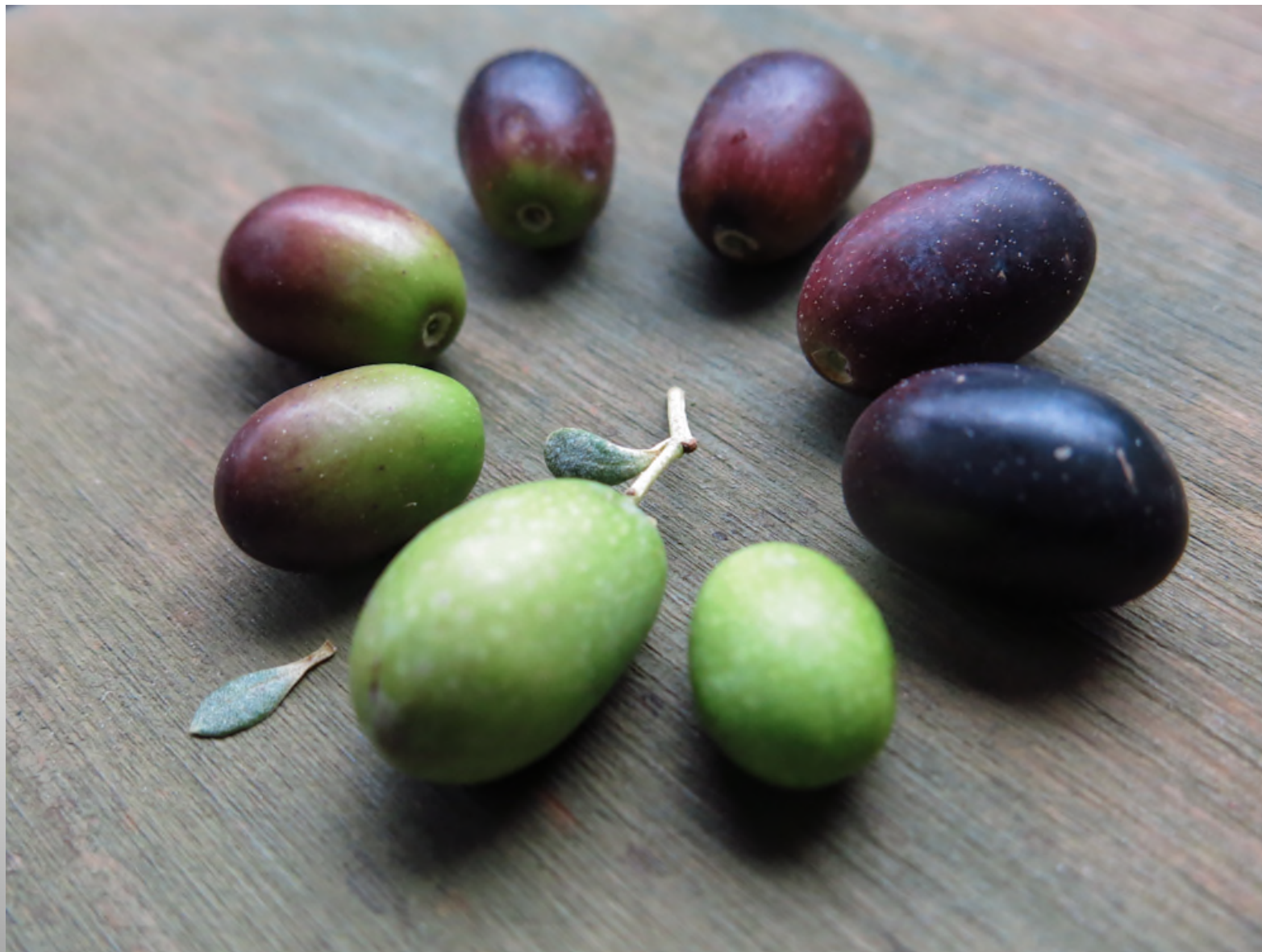
Convegno Nazionale Onas, Lonato del Garda 2017