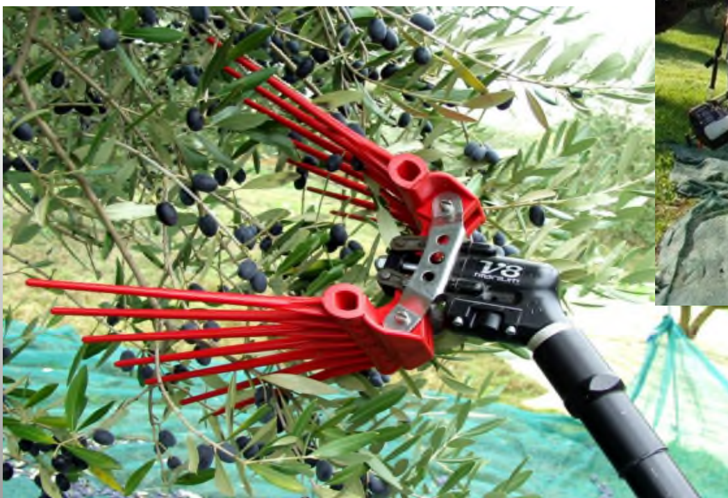
Pettine ad aria compressa