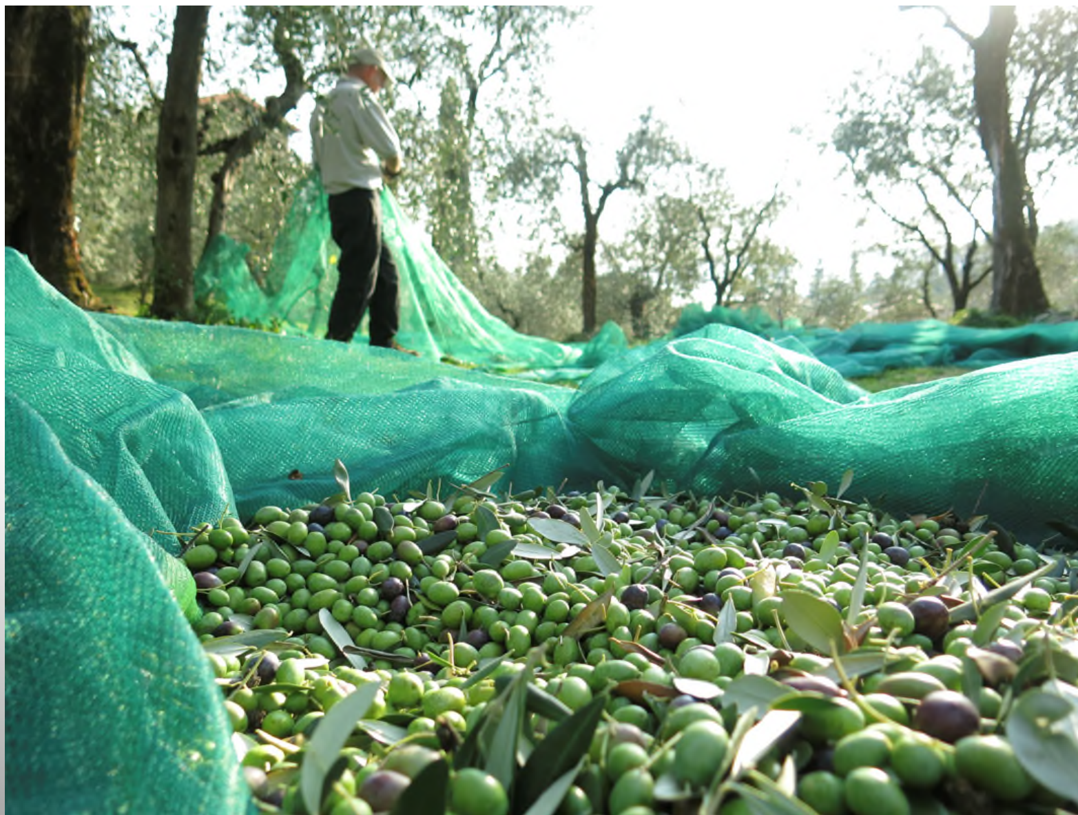
Convegno Nazionale Onas, Lonato del Garda 2017