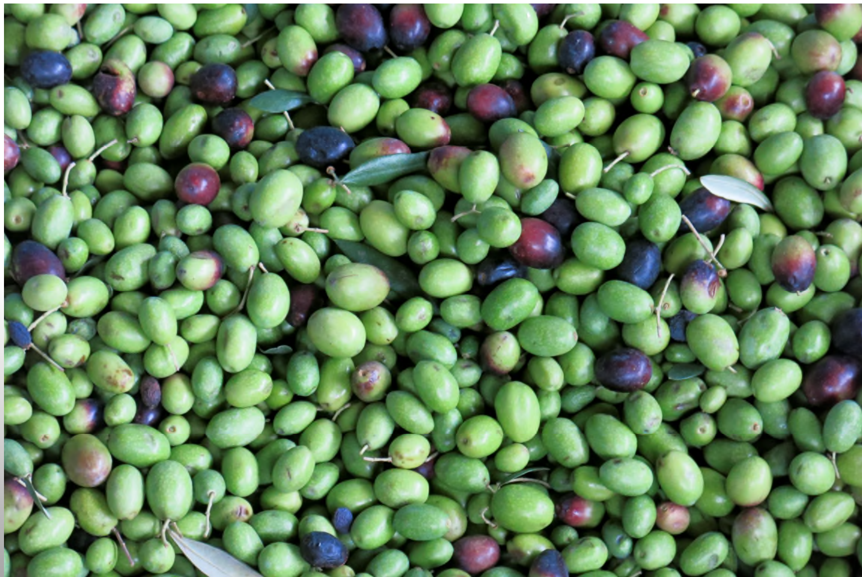
Convegno Nazionale Onas, Lonato del Garda 2017