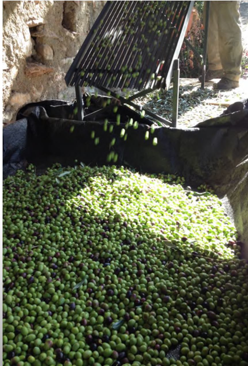
Convegno Nazionale Onas, Lonato del Garda 2017