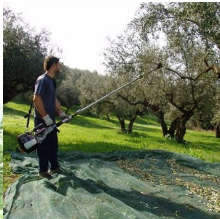
Scuotitore portatile a motore a scoppio